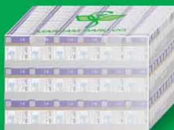
کارتن پلاست شامل سه سینی ۶۶ جعبه = ۱۹۸ جعبه