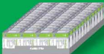
سینی شامل ۵۲ جعبه کپسول ۳۰ عددی