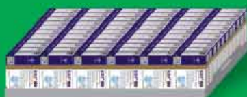
سینی شامل ۶۶ جعبه قرص ۸ عددی