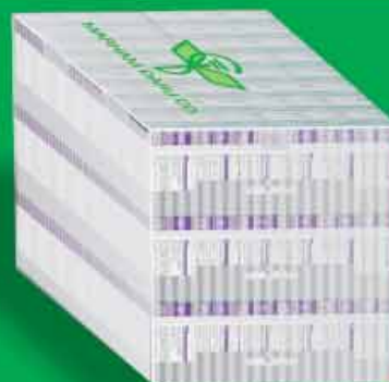
کارتن پلاست شامل سه سینی ۴۸ جعبه = ۱۴۴ جعبه