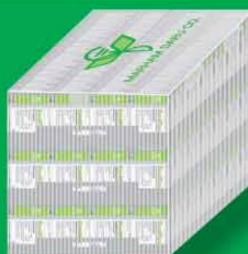
کارتن پلاست شامل سه سینی ۵۲ جعبه = ۱۵۶ جعبه