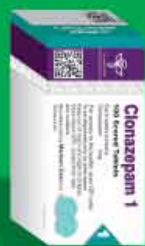
جعبه قرص ۱۰۰ عددی