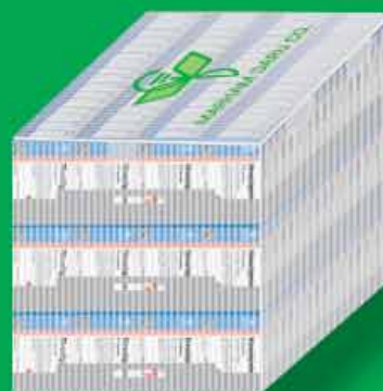
کارتن پلاست شامل سه سینی ۶۴ جعبه = ۱۹۲ جعبه