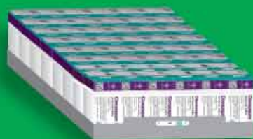
سینی شامل ۴۸ جعبه قرص ۱۰۰ عددی