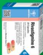
جعبه کپسول ۲۰ عددی