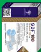
جعبه قرص ۸ عددی