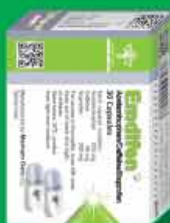
جعبه کپسول ۳۰ عددی