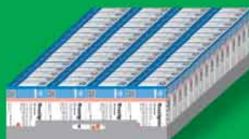
سینی شامل ۶۴ جعبه کپسول ۲۰ عددی